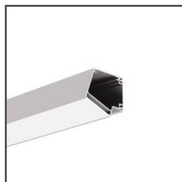
IMET A18012 Ref. arch 18012