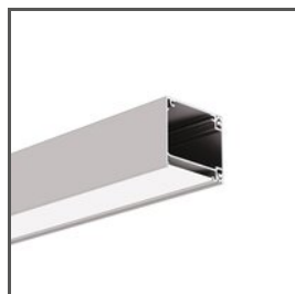
IKON A18013 Ref. arch 18013