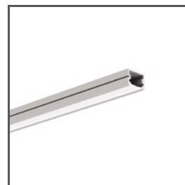
TAPO A01919 Ref. arch C1919