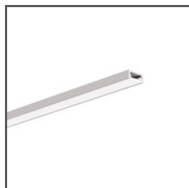
MICRO-ALU A01888 Ref. arch B1888