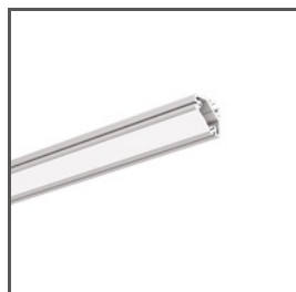
45-16 A08504 Ref. arch B8504