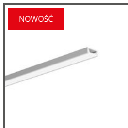
MICRO-PLUS A02966 Ref. arch C2966