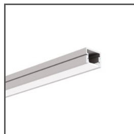
PDS-4-PLUS A01263 Ref. arch C1263