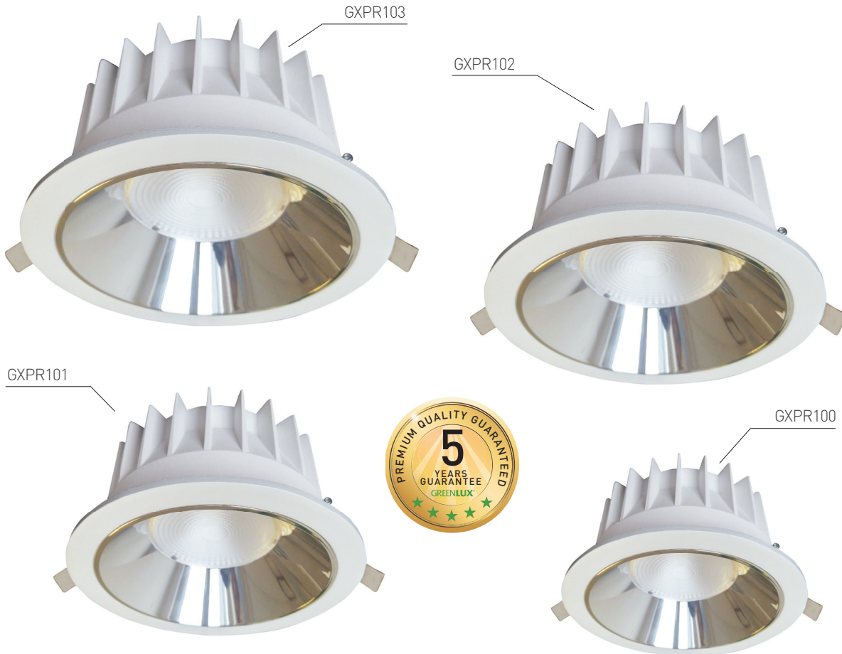
GXPR100 LINX PROFI-R 10W NW