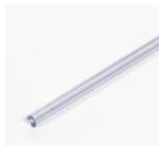
pręt zabezpieczający (00806)