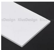
osłonka typu HSP47 mleczna (17051) przezroczysta (17062)