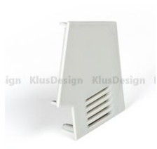
zaślepka IMET prawa, (24016) lewa, (24017)