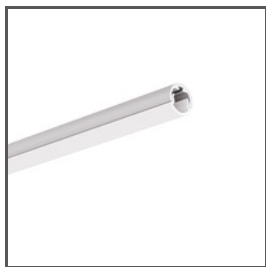
PIKO-O A01167 Ref. arch C1167