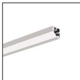
KUBIK-45 A07697 Ref. arch B7697