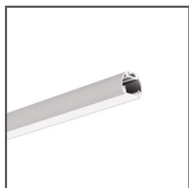
OLEK A08505 Ref. arch B8505