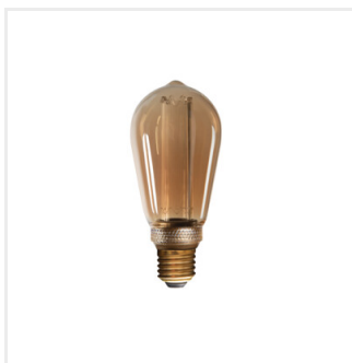
ST64 A 4W-SW