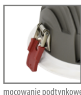
mocowanie podtynkowe za pomocą uchwytyów