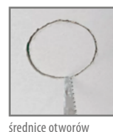
średnice otworów montażowych