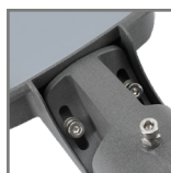
możliwość regulacji kąta pochylenia