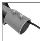
montaż na słupach Ø60