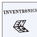
niezawodny zasilacz INVETRONICS