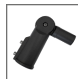
adaptery dostępne na stronie 61