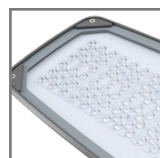
diody LED PHILIPS z soczewkami