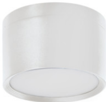
TIBERI PRO NT20W-940W