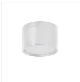
TIBERI PRO NT20W-940W