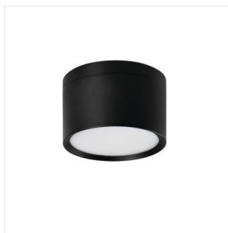
TIBERI PRO NT20W-940B