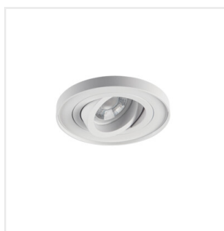
TINY BORD DTO-W