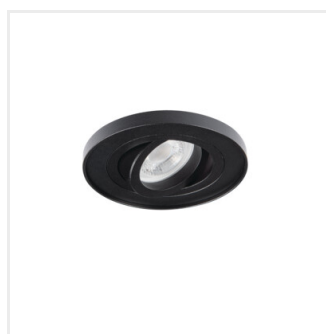
TINY BORD DTO-B