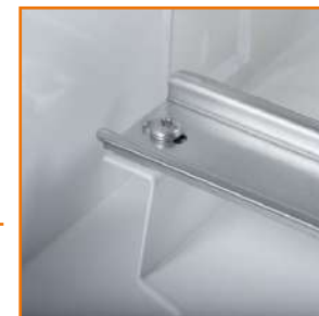
Profilowane wsporniki szyn powiększają przestrzeń boczną ułatwiając rozprowadzenie przewodów wewnątrz rozdzielni.