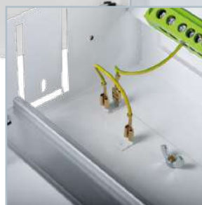
Dodatkowe uziemienie pozwala na montaż aparatury sygnalizacyjnej i sterującej na drzwiach zewnętrznych.