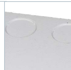
Przetłoczenia (do wybicia) umożliwiają wprowadzenie przewodów i montaż dławnic kablowych.