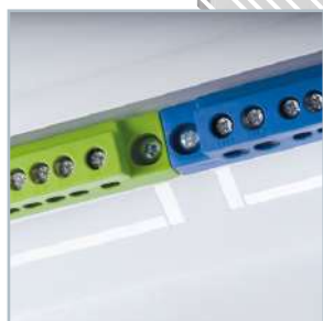
Ostionięte, dedykowane bloki PE i N, montowane pod kątem przyspieszają proces instalowania aparatury.