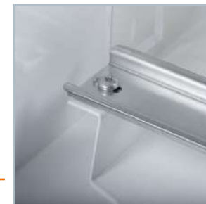
Profilowane wsporniki szyn powiększają przestrzeń boczną ułatwiając rozprowadzenie przewodów wewnątrz rozdzielnicy.