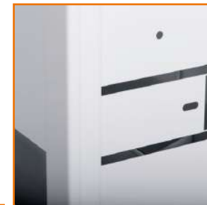
Boczne perforacje ułatwiają montaż.