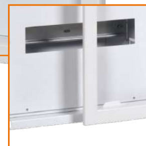
Zdemontowana ramka zewnętrzna zapobiega uszkodzeniom podczas montażu i prac wykończeniowych. Możliwość jej regulacji zapewnia estetyczny efekt wizualny.