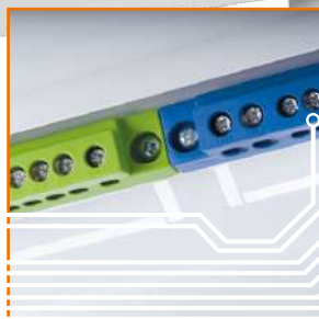
Ostonięte, dedykowane bloki PE i N, montowane pod kątem przyspieszają proces instalowania aparatury.