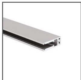
KRAV-56 A18017AZM Ref. arch 18017