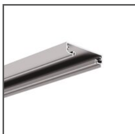
TESPO A18020 Ref. arch 18020