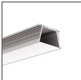
SEKOMA A06595 Ref. arch B6595