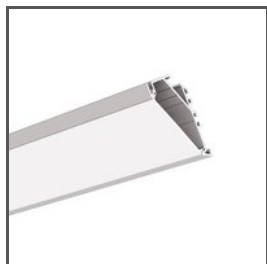
KOPRO-30 A07890 Ref. arch B7890