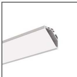
KOPRO A06367 Ref. arch B6367