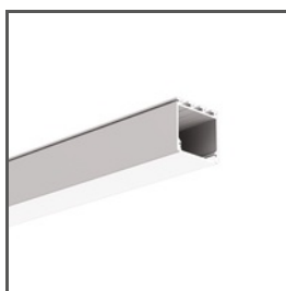
LIPOD A05554 Ref. arch B5554