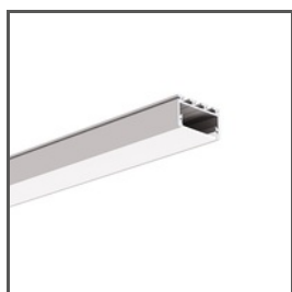
GIZA-LL A00758 Ref. arch C0758